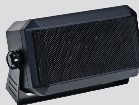
RSN4001 Głośnik zewnętrzny 13 W