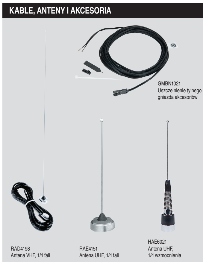
RAD4198 Antena VHF, 1/4 fali