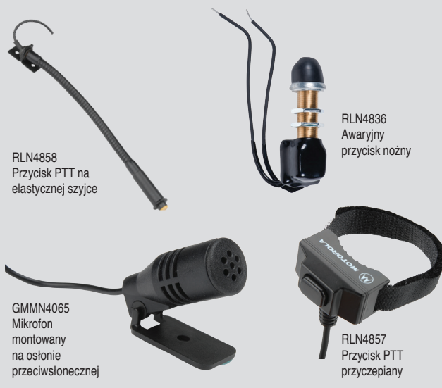
RLN4858 Przycisk PTT na elastycznej szyjce