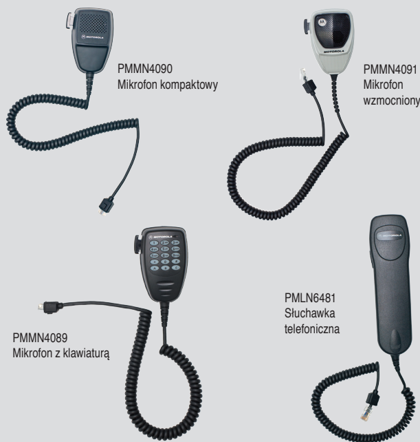
PMMN4090 Mikrofon kompaktowy