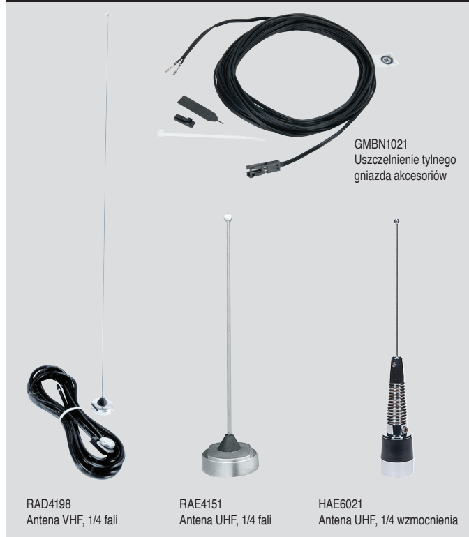
RAD4198 Antena VHF, 1/4 fali