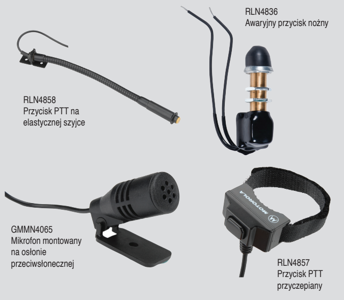
RLN4858 Przycisk PTT na elastycznej szyjce